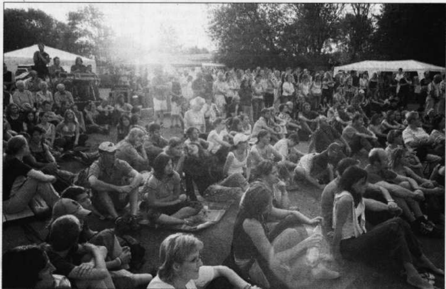
Rund 250 Besucher des Rock-Musicals erlebten eine hochwertige Unterhaltung.

„New Challenge“ steht für eine neue Herausforderung und das Bekenntnis zu Gott. Witz und Tief-