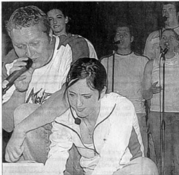
Chatten mit Gott – zum Teil gab es einfache Antworten auf schwierige Fragen in dem Stück „chat-a-live“ in Setzingen.

Thema des Stücks ist der Chat im Internet. Lisa, Goodgirl und Tommy 24 wollen sich, wie so viele Jugendli-