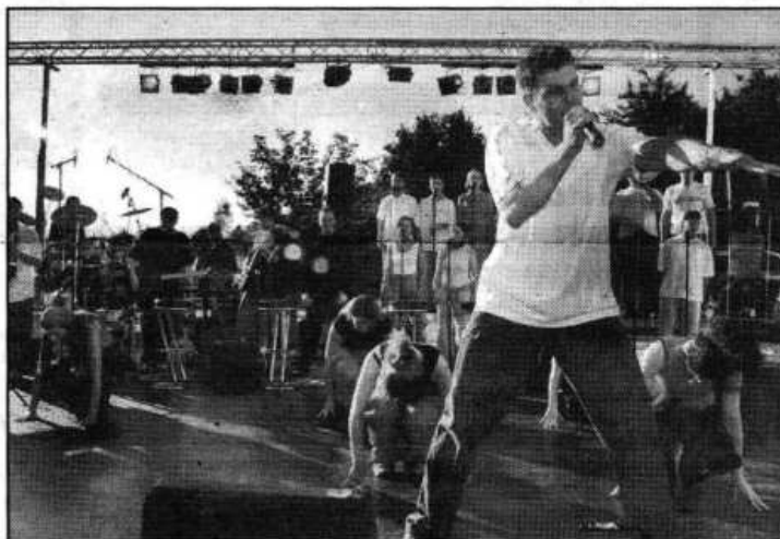
«chat-a-live» heisst das aktuelle Bühnenprogramm der internationalen Formation «new challenge», welche am 6. August in Langenthal gastiert.

aus: Neue Obergeraauerzeitung (NOZ), Freitag 02.08.2002