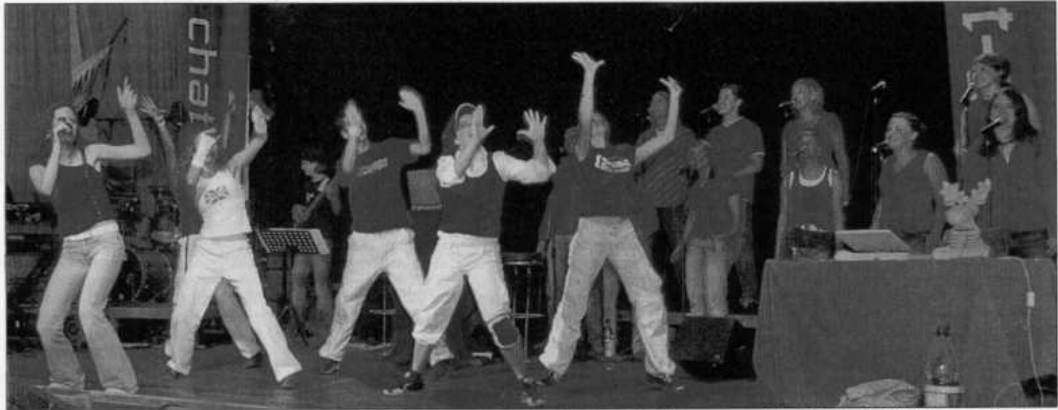
Junge Christen aus Deutschland und der Schweiz sorgten am Donnerstagabend für regen Publikumszuspruch im Hohndorfer „Weißen Lamm“ und begeisterten mit ihrem Programm.

Die aufgeführte Story „Chat-a-live“ zeigte in einer Show aus flotter Musik, Tanz und Schauspiel den Widerspruch zwischen virtueller und realer Identität, zwischen Computerchat und Wirklichkeit. Insgesamt 27 junge Leute im Alter zwischen 15 und 26 Jahren standen als Tänzer, Schauspieler, Musiker und als Chor auf der Bühne und präsentierten ein ansprechend klingvolles Spektakel. „Ziel des Projektes ist ei-