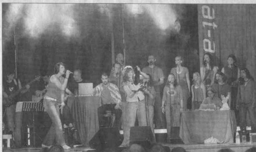
27 junge Leute gastierten am Freitagabend im Cranzahler „Turnerheim“. Das deutschlandweite Musikprojekt „New Challenge“ lieferte eine perfekte Show.

„New Challenge ist eine Arbeit innerhalb des Vereins für Musik-Evangelisation (VME). Eine Woche lang haben wir alles einstudiert und sind dann auf Tour gegangen“, erklärte Tournee-Verantwortlicher Andre Pfulrich vom VME.